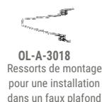
OL-A-3018 Ressorts de montage pour une installation dans un faux plafond