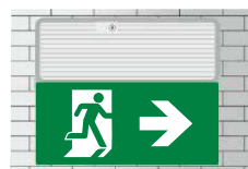
Muurmontage met SP-116