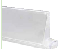
OL-A-9100/ST Plastic dubbelzijdige diffuser

Zelfklevende pictogrammen apart te bestellen